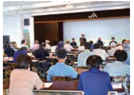
▲制度へ対応するため多くの参加者が集まりました(写真は千代田支店会場)

広島北部管内では、993人が直売所へ出荷登録しており、主な出荷先として同JAが運営する「ベジパーク安芸高田」や広島市の「とれたて元氣市」等の直売所の他、広島県内量販店のインショップへ出荷しています。JAでは、制度の対応に追われるなか出荷時に商品に貼るバーコードをインボイ