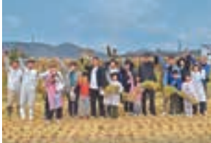
▲家族で稲作チャレンジ