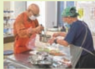
切った野菜にピクルス液を入れ、冷蔵庫で半日から一晩漬ければ美味しいピクルスの完成!