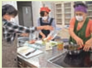
食材は、きゅうり、ニンジン、パプリカを使用。

アグリセミナーは、3月まで講座を予定しています。興味のある方は、下記までお問い合わせください。