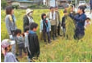
▲生協稲刈り交流会